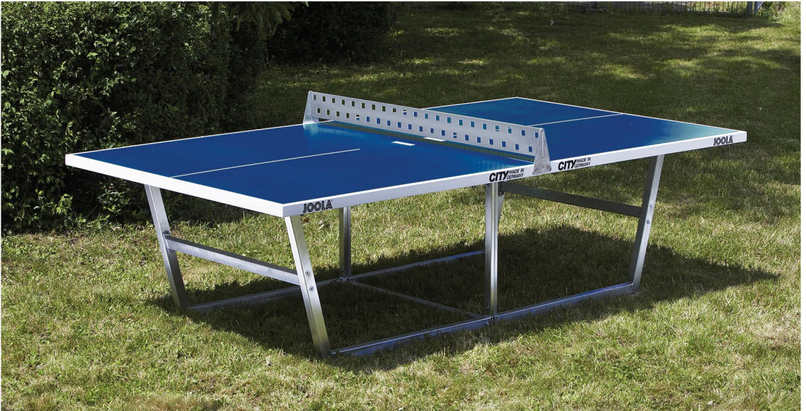
Art. 11700 JOOLA CITY blau / blue

JOOLA Tischtennis GmbH & Co. KG Wiesenstr. 13 D-76877 Siebeldingen Tel.: ++49 - 63 45 - 95 47 - 0 Fax: ++49 - 63 45 - 95 47 - 11 email: info@joola.de www.joola.com